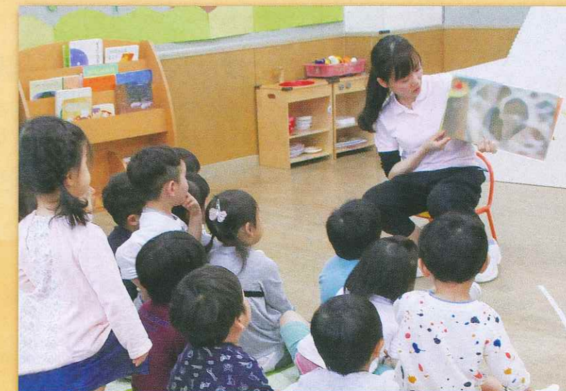
みんなで絵本をみる