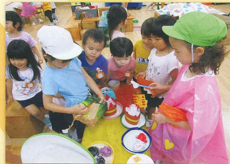
品物をつくってお店屋さんごっこをする