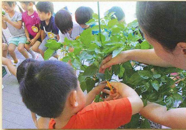
野菜を育てて収穫する

遊びは幼児期にふさわしい学びです。 遊びを通してどのような力を身に付けていくのでしょうか？